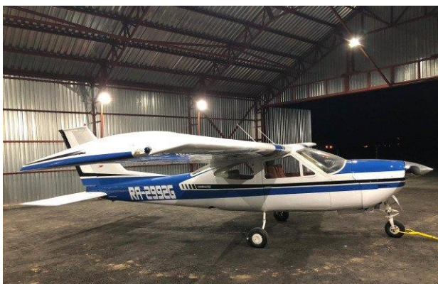
1. Внешний вид справа*