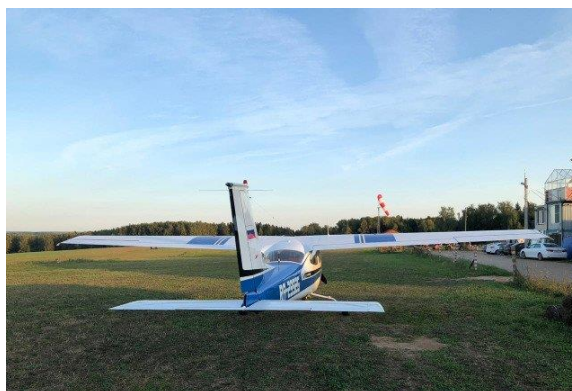
4. Внешний вид сзади*